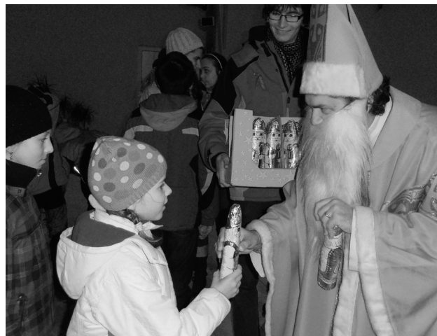
sviatok sv. Mikuláša v našej farnosti

Prosíme všetkých členov Centra, aby poplatky na druhý školský polrok uhradili v pracovnom čase v Centre do 15. januára.