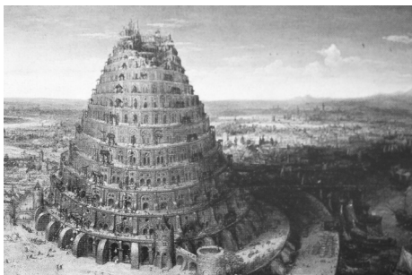
Predstavy o tom, ako vyzerala Babylonská veža, sa rôznia. Najpravdepodobnejšia podoba je na obrázku vpravo.

Svätý Ján Zlatoústý o správaní sa človeka z tohto príbehu povedal: „Človek namiesto toho, aby žil v istých hraniciach, túži mať stále viac a baží za stále väčšími vecami. Deje sa tak preto, lebo stratil schopnosť rozpoznať vlastnú ohraničenosť. Po tom, ako si zaobstará majetky a pozície, stratí z dohľadu pravú prirodzenosť a pachtí po takej výške, že sa nakoniec prepadne do priepasti.“